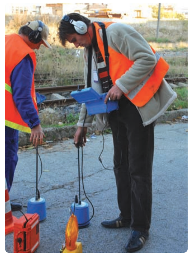
Microfon de sol sau „picior de elefant”

Dezvoltarea așezărilor umane, implicit a rețelelor de apă, a făcut necesară introducerea contorizării pe zone, care cuprind între 500 și 3.000 de branșamente. În aceste zone se introduc