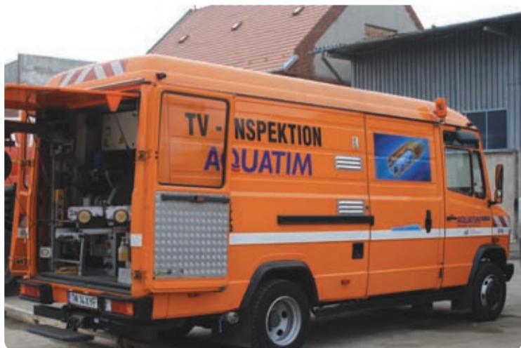
Autoutilitara pentru inspecția video a canalelor