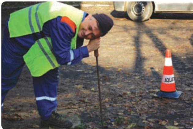
Ascultarea pierderilor cu tijă metalică

Toate tehnologiile de depistare a pierderilor se bazează pe un principiu foarte simplu: apa care țâșnește dintr-o conductă aflată sub presiune produce zgomot.