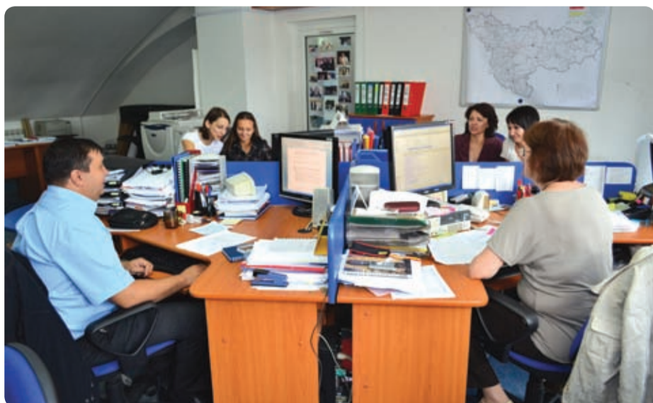
Unitatea de implementare a proiectelor de la Aquatim