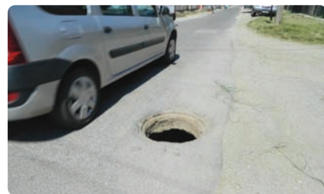
Capacele de canal lipsă pun în pericol mașinile și trecătorii