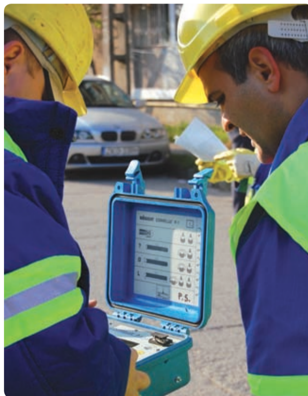
Corelator pentru detecția pierderilor

În primii ani din secolul XXI a fost dezvoltată o tehnologie bazată pe loggeri acustici combinați cu corelatorul de zgomote. Loggerii sunt dispozitive care au capacitatea de a realiza ascultarea rețelei pe timp de noapte, între intervale programate ca fiind cu consum redus (recomandabil fiind intervalul 2-4 AM). Aceștia memorează informațiile, iar apoi datele obținute se pot descărca și interpreta.