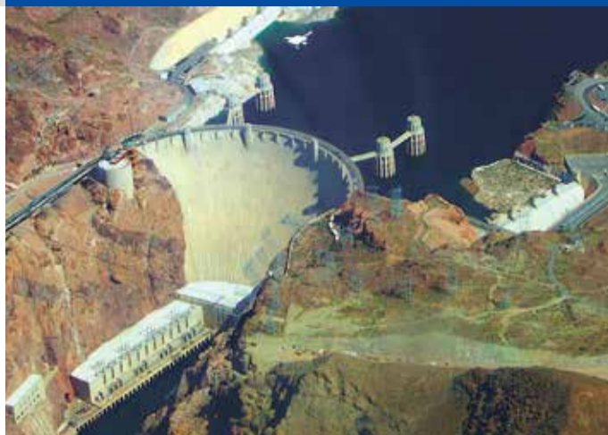
Barajul Hoover