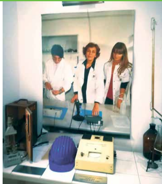
Muzeul apei comunitare, Deva

Portalul dedicat clienților, accesibil de pe prima pagină a site-ului nostru, www.aquatim.ro , pune la dispoziție, pe lângă plata online a facturii, cu card bancar, alte câteva facilități, menite să simplifice lucrurile pentru cei care preferă versiunile electronice clasicele hârtii.